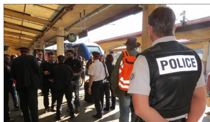
■ Une trentaine d'agents de la SNCF et de policiers ont mené une vaste opération de contrôle, mercredi à la gare de Belfort.